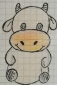
Письмо от Кирилл Кирилл

Здравствуй дедушка Мороз! В этом году я старалась вести себя хорошо. Хотим пожелать много счастья на этот новый год. Маме очень хочется превратить этот новый год и елку, которую мы имеем в этот новый год! Желаю тебе счастья и здоровья! С Новым годом!